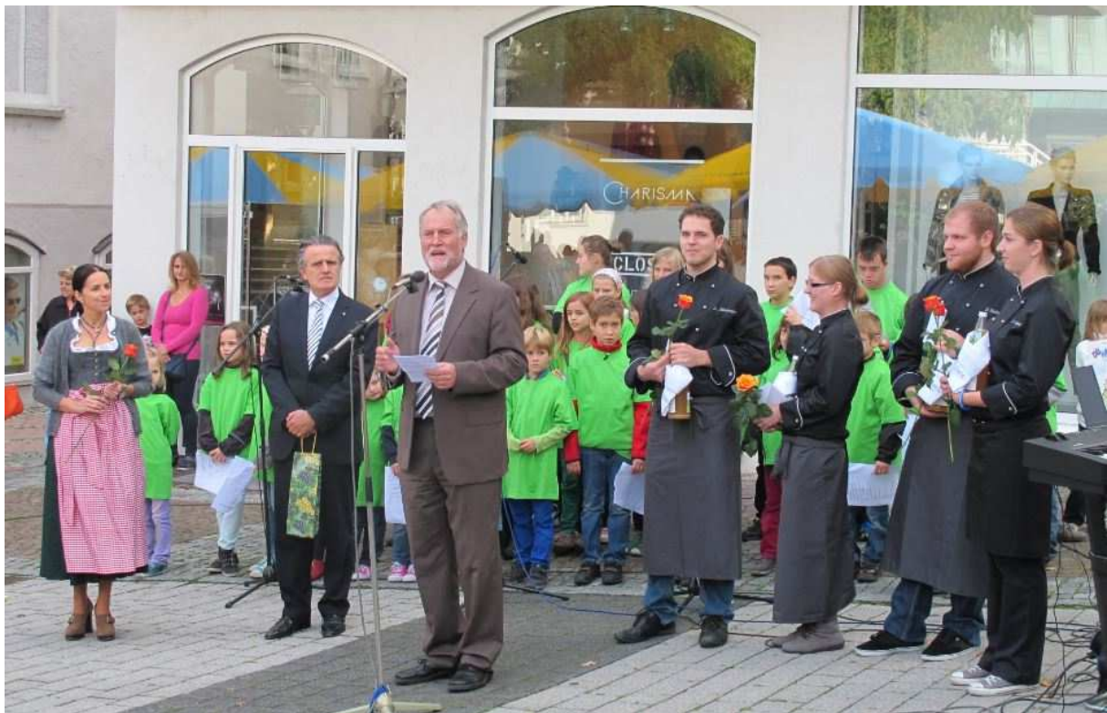
Backnanger Apfelfest 2013

Als weitere Attraktion des Apfelfestes wird auf dem Backnanger Obstmarkt der Gospelchor Oppenweiler zu einem Gospelday singen.