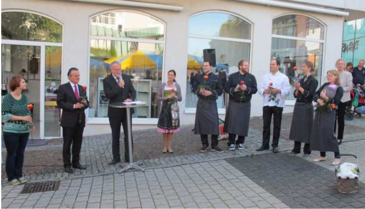
Backnanger Apfelfest 2014