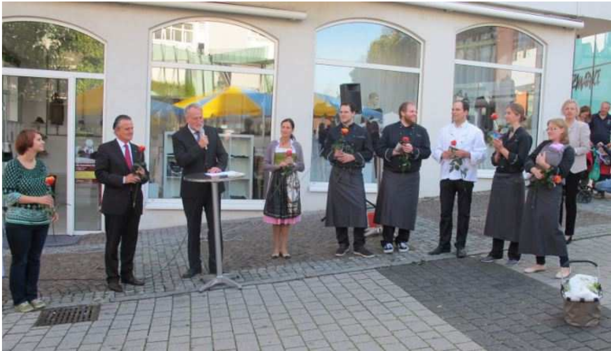
Backnanger Apfelfest 2014